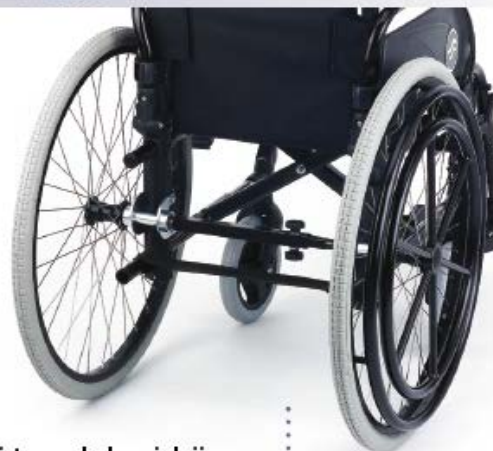
Sistema de hemiplejía