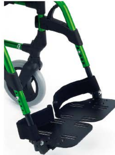
Plataformas de aluminio regulables en ángulo