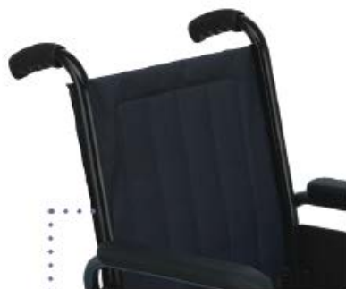
Tapicería de nylon soldado