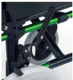
Alargador de freno

Frenos de tambor para rueda de 24" y 12"