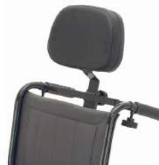
Reposacabezas de skay