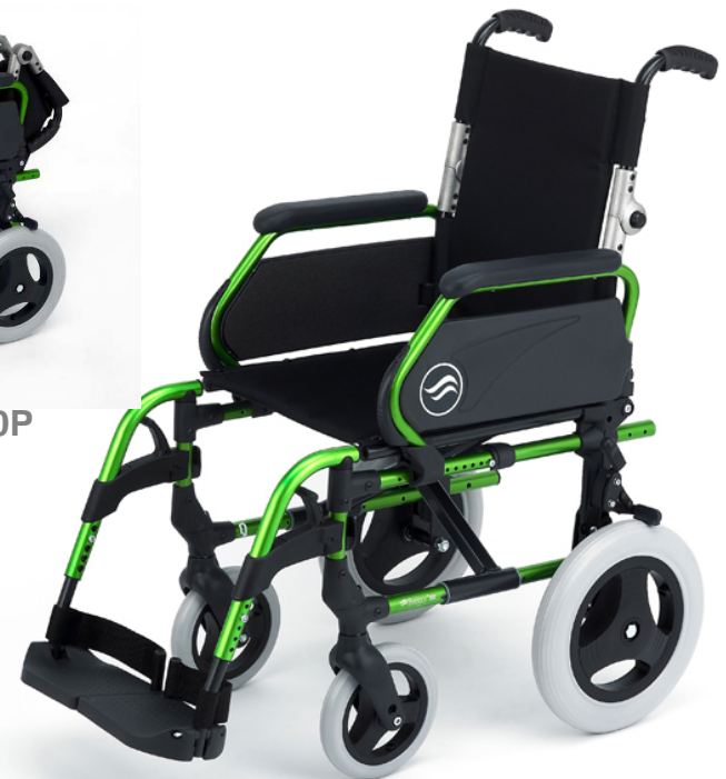
Breezy 300P con ruedas traseras de 12" macizas