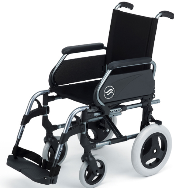
Breezy 300 con ruedas traseras de 12" macizas