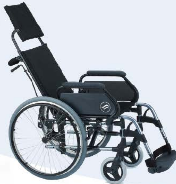
Modelo Breezy 300R Respaldo Reclinable