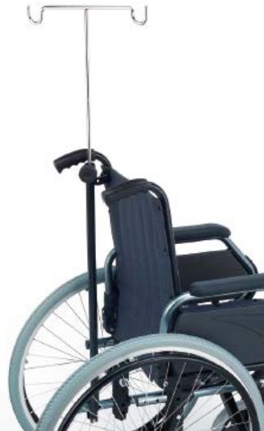
2 tipos de soporte de gotero