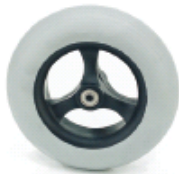
Ruedas delanteras de 8" macizas o neumáticas o de 6" macizas