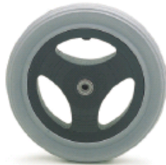
Ruedas traseras de 12" (neumáticas o macizas)