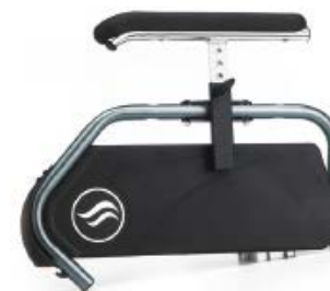
Reposabrazos regulables en altura