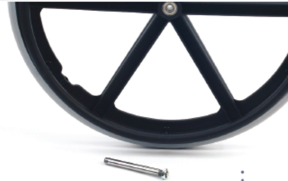
Eje de desmontaje rápido para ruedas traseras