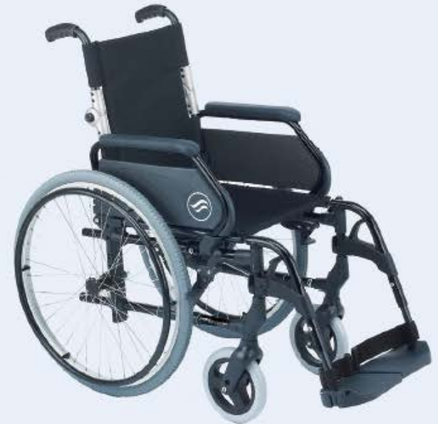
Modelo Breezy 300P Respaldo Partido