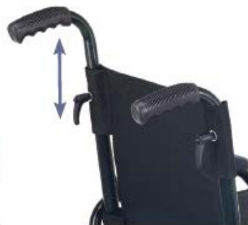
Empuñaduras ajustables en altura