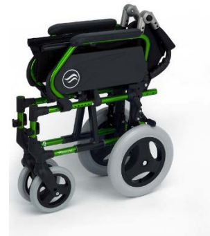
Breezy 300P plegada