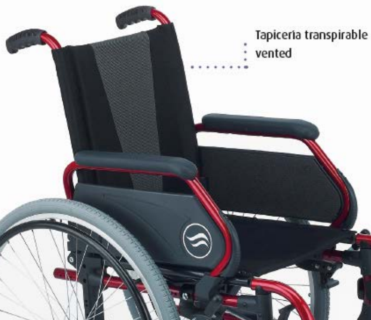
Tapicería transpirable vented