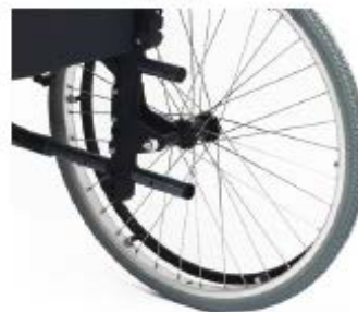
Sistema doble amputado