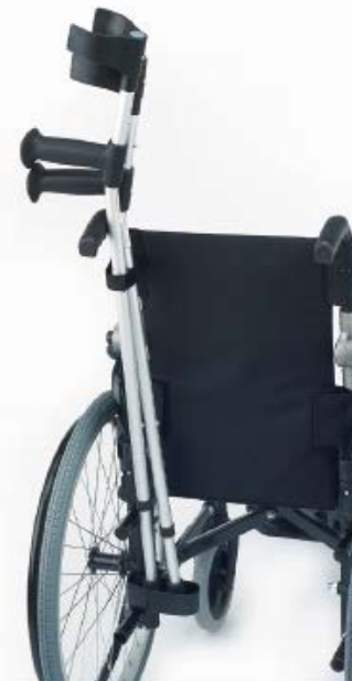
Soporte de bastones