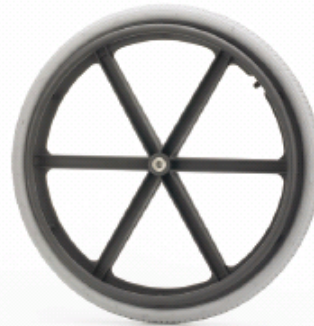
Diferentes opciones de ruedas traseras: de 22" o 24", con radios, Sport, neumáticas, macizas