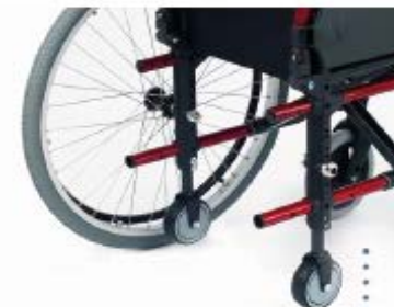
Ruedas de tránsito .....