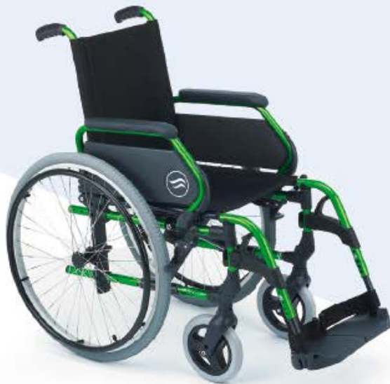
Modelo Breezy 300 Respaldo Standard

3 modelos en función del tipo de respaldo